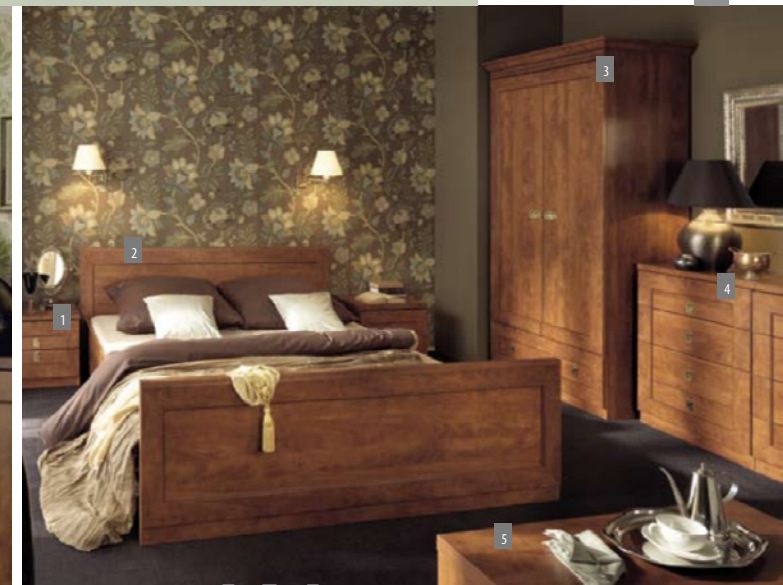
Schlafzimmer: 1. Nachtkommode KOM2S/50; 2. Bett LOZ/160; 3. Schrank SZF2D1S/90; 4. Kommode KOM4S/60; 5. Truhe KUF/85.