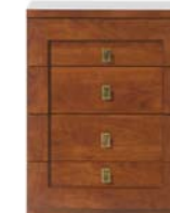
Kommode KOM4S/60 H./B./T. 82/60/41,5 cm