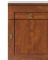
Kommode KOM1D1S/60 H./B./T. 82/60/41,5 cm