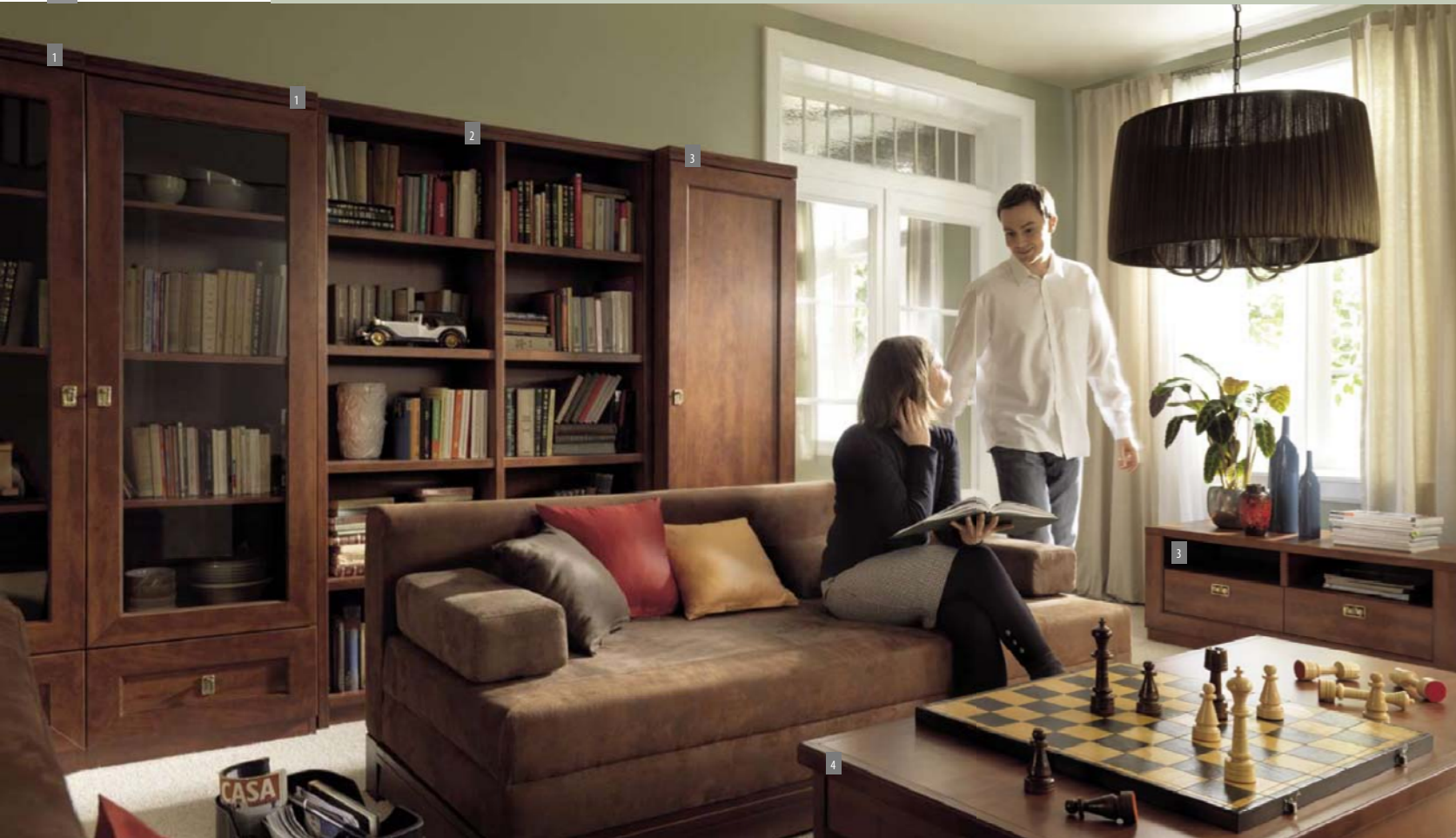
Wohnzimmer: 1. Vitrine REG1W1S/60; 2. Regal REG/120; 3. Regal REG1D1S/60; 4. Beistelltisch LAW/130;