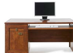
Schreibtisch BIU/140 H./B./T. 75,5/70/140 cm

copyright Alle Inhalte sind nur für eigene private Zwecke bestimmt. Jede weiter gehende kommerzielle oder nicht kommerzielle Verwendung, insbesondere die Speicherung, Veröffentlichung, Vervielfältigung und jede Form von gewerblicher Nutzung sowie die Weitergabe an Dritte - auch in Teilen oder in überarbeiteter Form - ohne schriftliche Genehmigung der Firma Krotter ist untersagt