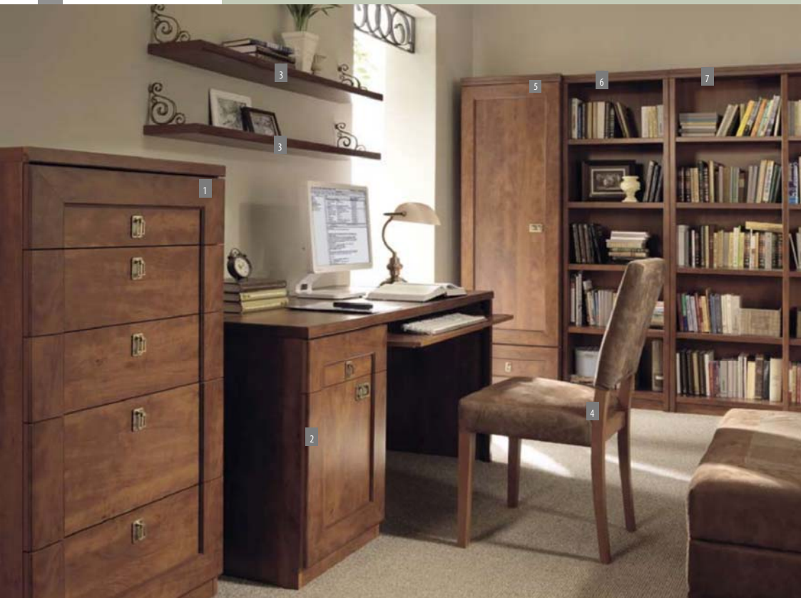
Arbeitszimmer: 1. Kommode KOM5S/60; 2. Schreibtisch BIU/140; 3. Hängeregal POL/120; 4. Stuhl BIGGER; 5. Regal REG1D1S/60; 6. Regal REG/60; 7. Regal REG/120.