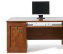
Schreibtisch BIU/140 H./B./T. 75,5/70/140 cm