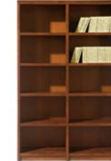
Regal REG/120 H./B./T. 194,5/120/35 cm

*passende Matratze finden Sie auf www.bs-moebel.de