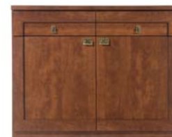
Kommode KOM2D2S/120 H./B./T. 82 /120/41,5 cm

copyright Alle Inhalte sind nur für eigene private Zwecke bestimmt. Jede weiter gehende kommerzielle oder nicht kommerzielle Verwendung, insbesondere die Speicherung, Veröffentlichung, Vervielfältigung und jede Form von gewerblicher Nutzung sowie die Weitergabe an Dritte - auch in Teilen oder in überarbeiteter Form - ohne schriftliche Genehmigung der Firma Krotter ist untersagt