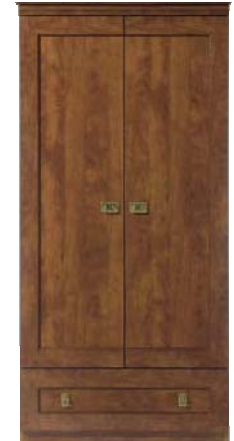
Schrank SZF2D1S/90 H./B./T. 194,5/90/57 cm