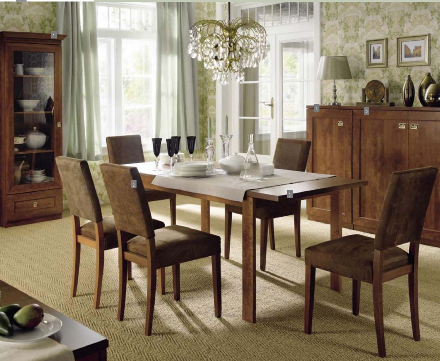
ESSZIMMER: 1. Vitrine REG1W1S/60; 2. Stuhl BIGGER; 3. Tisch STO/150; 4. Kommode KOM1D/60; 5. Kommode KOM2D/120.