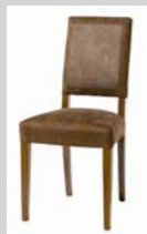
Stuhl BIGGER H./B./T. 96/46/57 cm