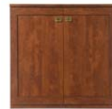
Kommode KOM2D/120 H./B./T. 119/120/41,5 cm