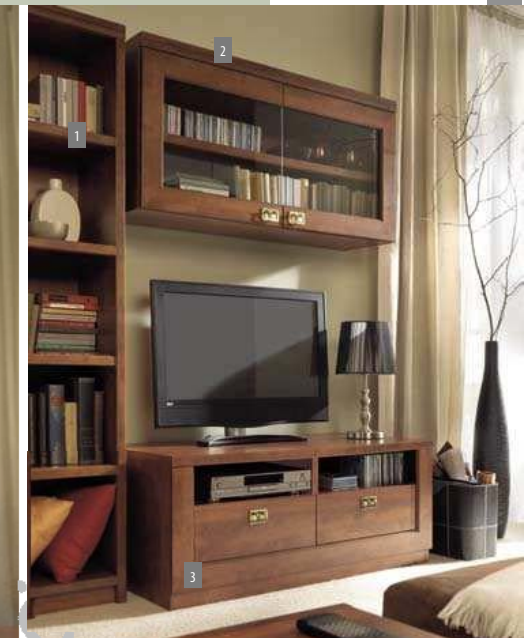
1. Regal REG/60; 2. Hängevitrine SFW2D/120; 3. TV-Unterschrank RTV2S/120