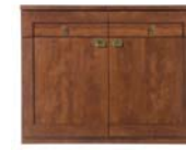
Sideboard KOM2D2S/120 H./B./T. 82 /120/41,5 cm